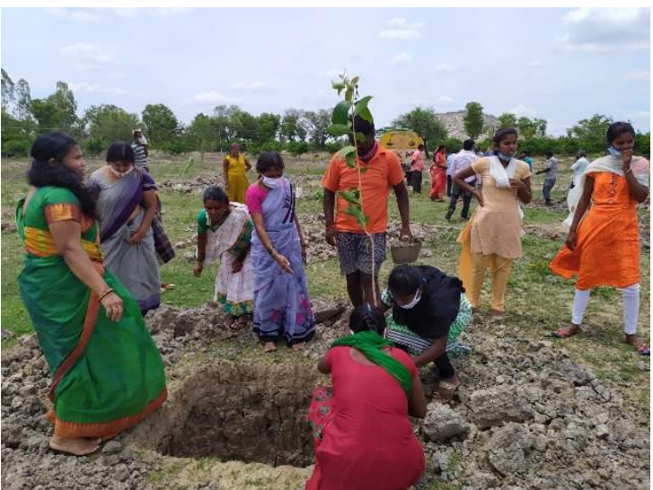
BANK FACILITY TO MGNREGA WOKERS AT HONNASETTHALLI VILLAGE