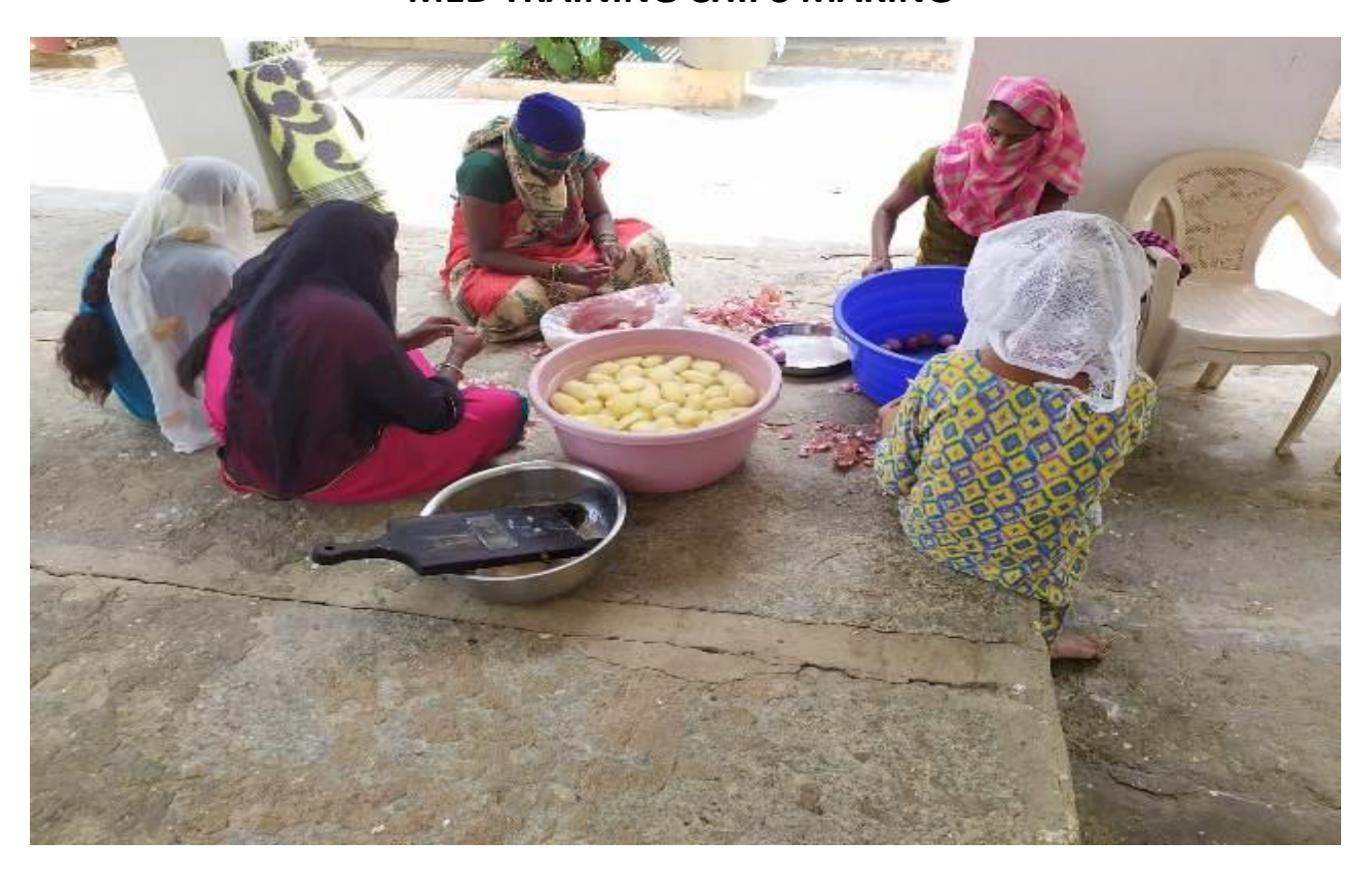
MED TRAINING -ONION FLAKHS MAKING