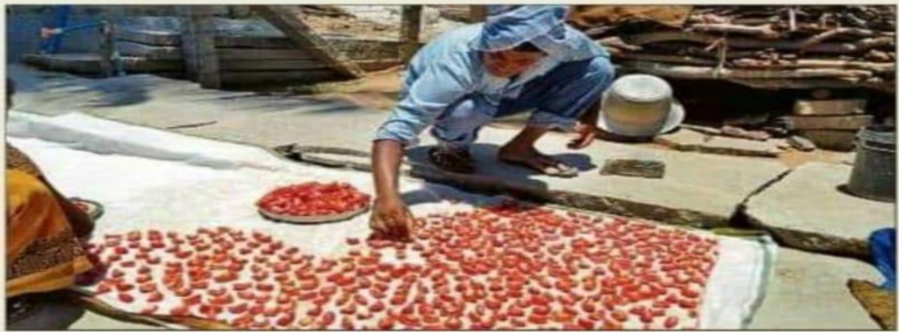
A farmer dries up tomatoes to make tomato flakes in Mulbagal, Kolar district.