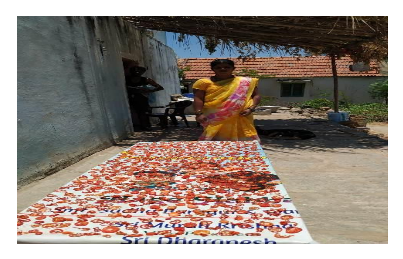
MED TRAINING -TOMATO PICKLE MAKING- SUN DRYING