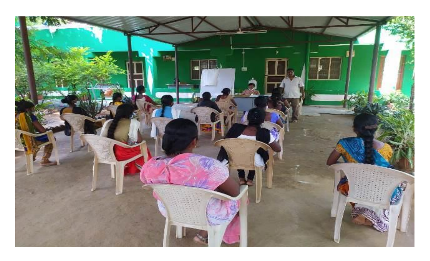
YOUTH TRAINING ON GRAMA PANCHAYAT DEVELOPMENT PLAN